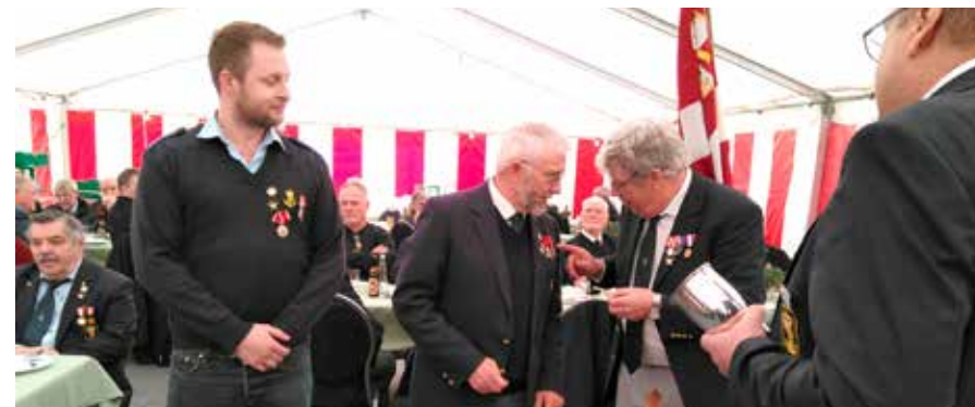
Og så kan der vist også lige blive plads til disse to stemningsbilleder fra Landsskyttestævnet: