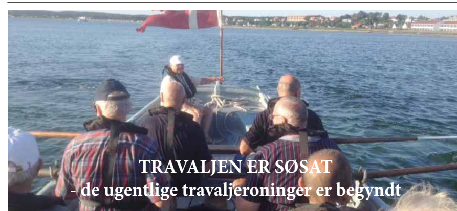
Første ro-aften i år, 30. maj