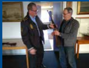
Gaver til foreningen.....14