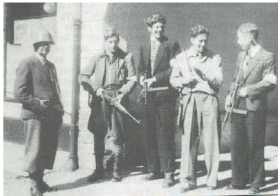
Medlemmer af den lokale modstandsgruppe på vagt i Hotel Vigens port for at bevogte de internerede værnemagere efter Befrielsen.